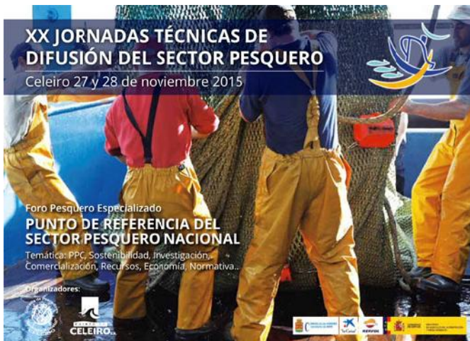
Cartel divulgativo de las jornadas.

Más de una docena de ponentes se dan cita para abordar los retos presentes y futuros de la Política Pesquera Común